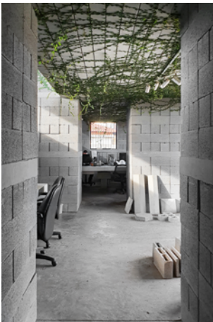
▲ Sede de uma Fábrica de Blocos Avaré, SP. 2016 fotos: Vão

Na atividade acadêmica foi professor assistente da disciplina curricular 'Projeto I', na Escola da Cidade (São Paulo), de 2016 a 2017, professor titular da disciplina de 'Projeto' na Faculdade Eduvale (Avaré), de 2018 a 2019 e professor convidado do 'Taller Sudamérica', na FADU-UBA (Buenos Aires) de 2020 a 2022.