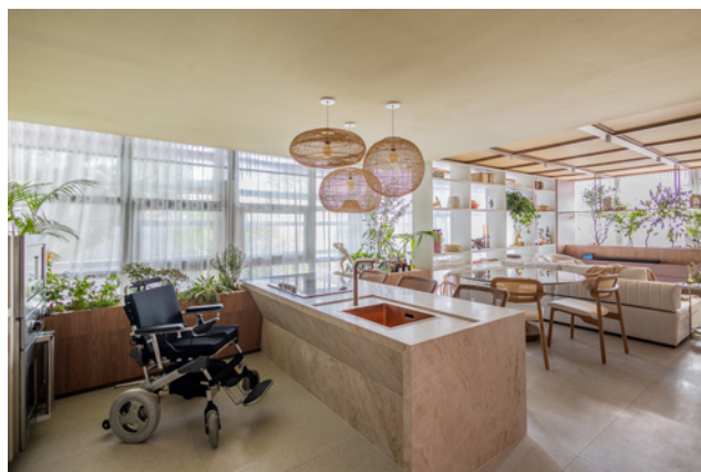
◀ ▲ Casa do Ser, CasaCor São Paulo, SP. 2023