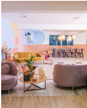
▲ Casa Forecer, Westwing São Paulo, SP. 2023

Mulher negra, arquiteta, urbanista e designer que em sua atuação tem desenvolvido projetos de arquitetura, arquitetura de interiores, expografia e cenografia. Atua como docente assistente no Estúdio Vertical, ateliê de projeto interdisciplinar na Associação Escola da Cidade, e como professora titular das disciplinas ligadas à representação gráfica projetual no curso técnico de Edificações do Liceu de Artes e Ofícios de São Paulo. Gerenciou durante 5 anos os processos operacionais, enquanto sócia da ARQTAB - Arquitetura e Design. Colabora, desde 2018, com o Projeto Arquitetas Negras, no processo de mapeamento da produção nacional de arquitetas negras brasileiras, em parceria com a também arquiteta Gabriela de Matos. Profissional selecionada pelo editorial do livro "Arquitetas Negras - Volume I", primeira publicação produzida por arquitetas negras no Brasil. Integra a atual gestão do Cambará - Instituto de Fomento à Arquitetura Afrobrasileira, gerenciando e difundindo projetos que estimulam e promovem debate acerca da cultura arquitetônica negra nacional, através da conexão entre (de) profissionais negros. Compõe a gestão do IAB SP enquanto Diretora de Comunicação e Programação, tendo como foco os processos ligados às ações culturais, e de gestão da 14ª Bienal Internacional de Arquitetura de São Paulo.