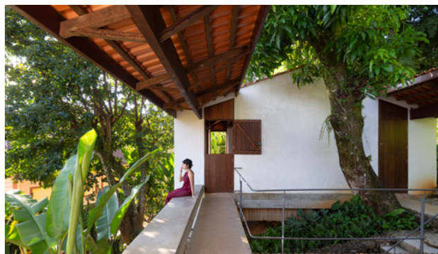
◀ Casa São José do Barreiro São José do Barreiro, SP. 2022