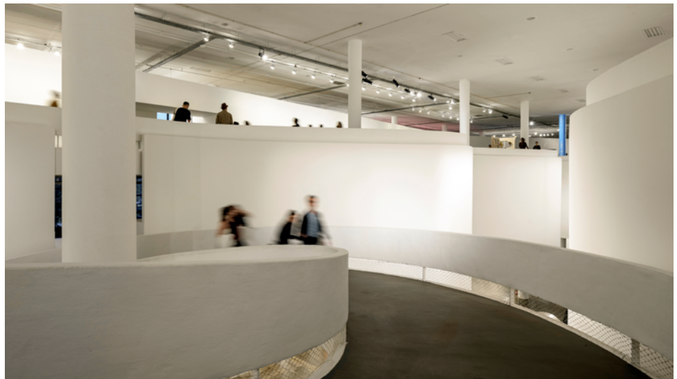
▲ Expografia para 35ª Bienal de São Paulo São Paulo, SP. 2023